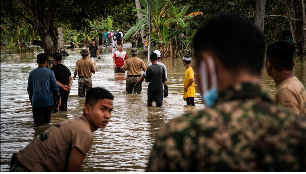
Malezyya'da muson yağmurları: 34 bin 525 kişi tahliye edildi

-Haber başlıklarının ve/ya resimlerin üzerine tıklayarak haberlerin orijinal kaynaklarına gidebilir ve konular hakkında daha detaylı bilgiye ulaşabilirsiniz.