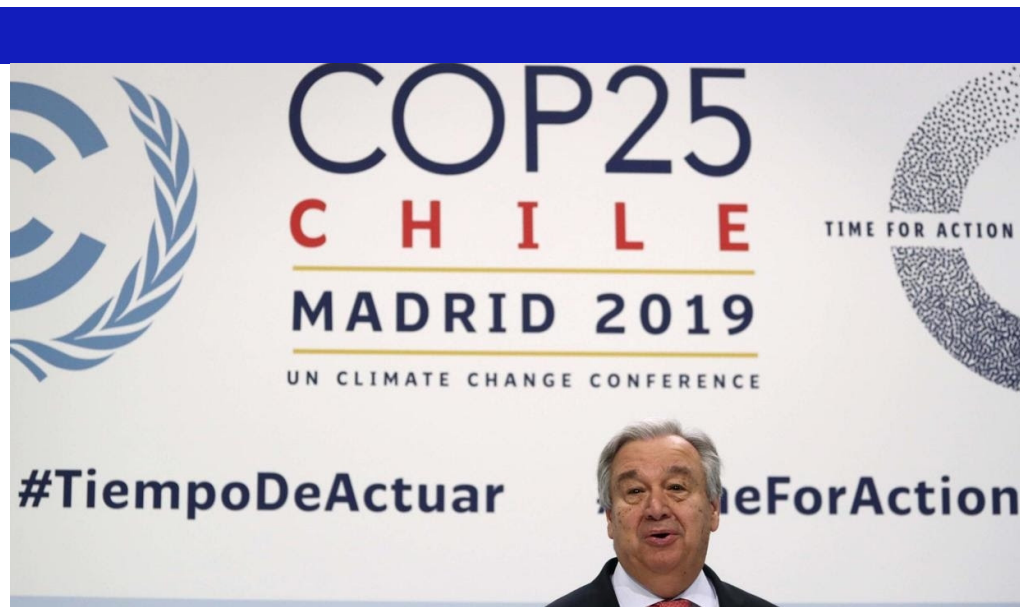
13 Aralık'a kadar sürecek olan COP25 başladı.